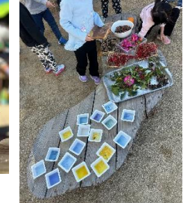
アロエのとげとげ